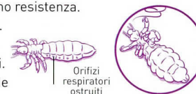
Orifizi respiratori ostruiti